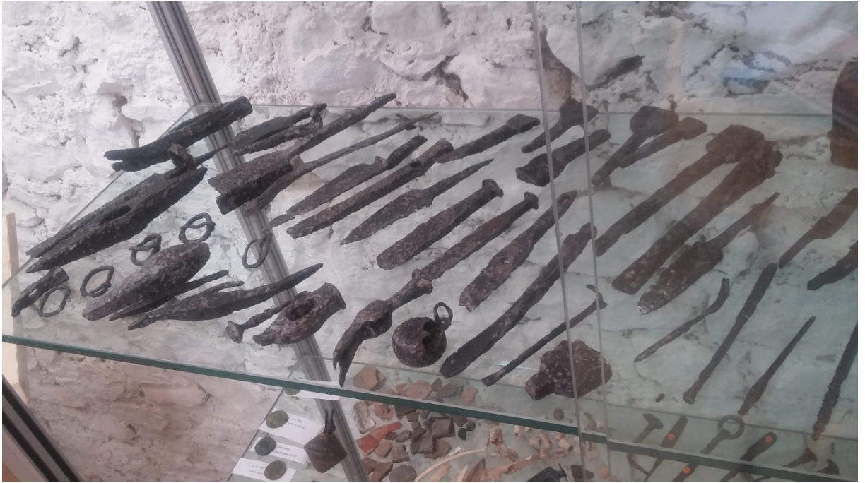
Römische Eisenwerkzeuge (Vitrine Privatsammlung Aringer).