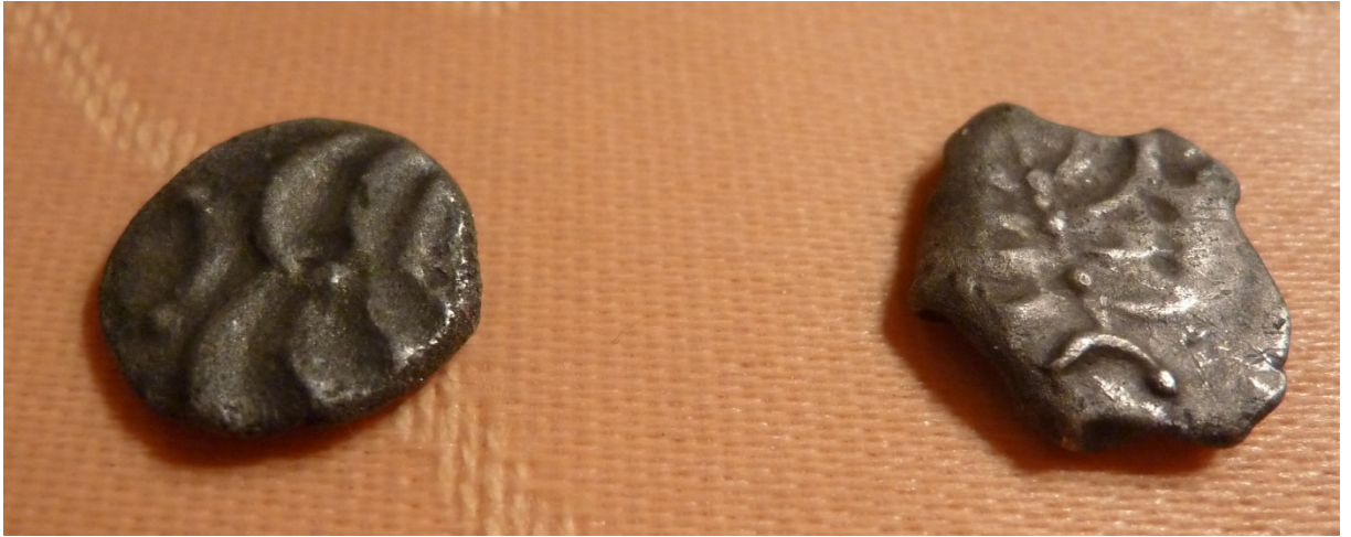
Keltische Silbermünzen (Vitrine Privatmuseum Aringer).