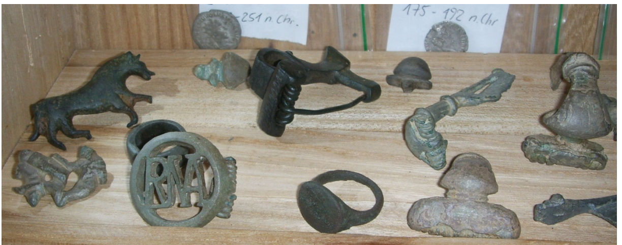
Auswahl römischer Fibeln und Münzen (Vitrine Privatmuseum Aringer).