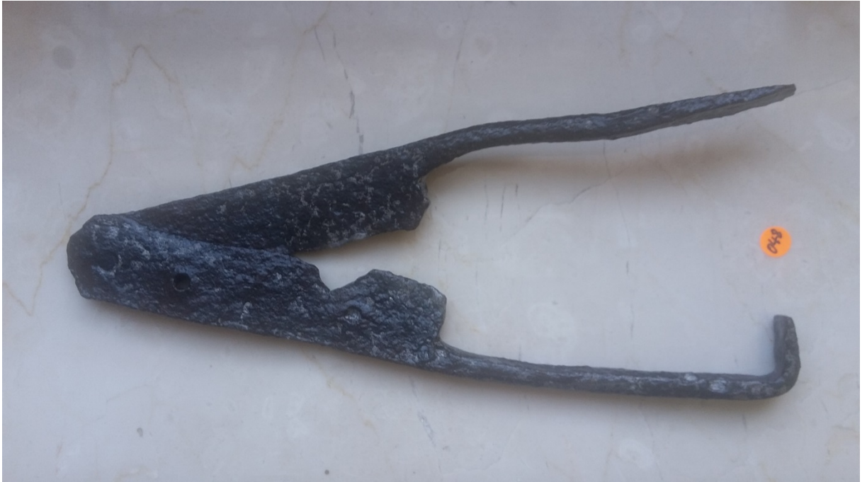
Römische Kastrierzange aus Eisen (von der Fluchthöhle).