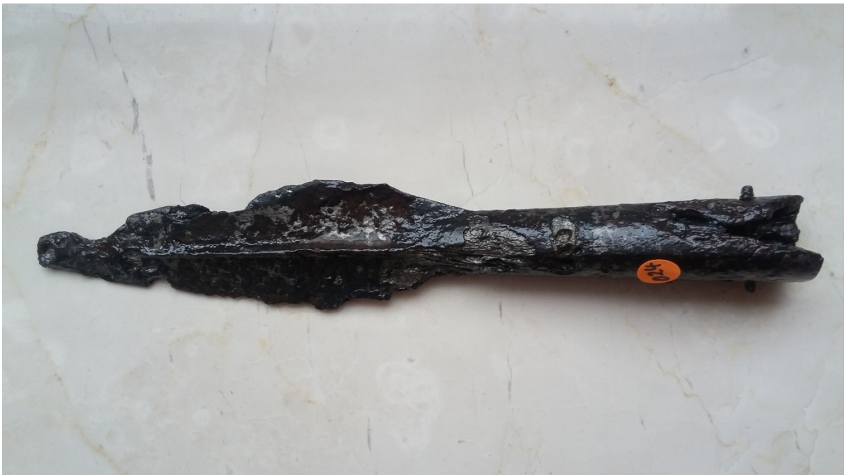
Römische Lanzenspitze aus Eisen (von der Fluchthöhle).