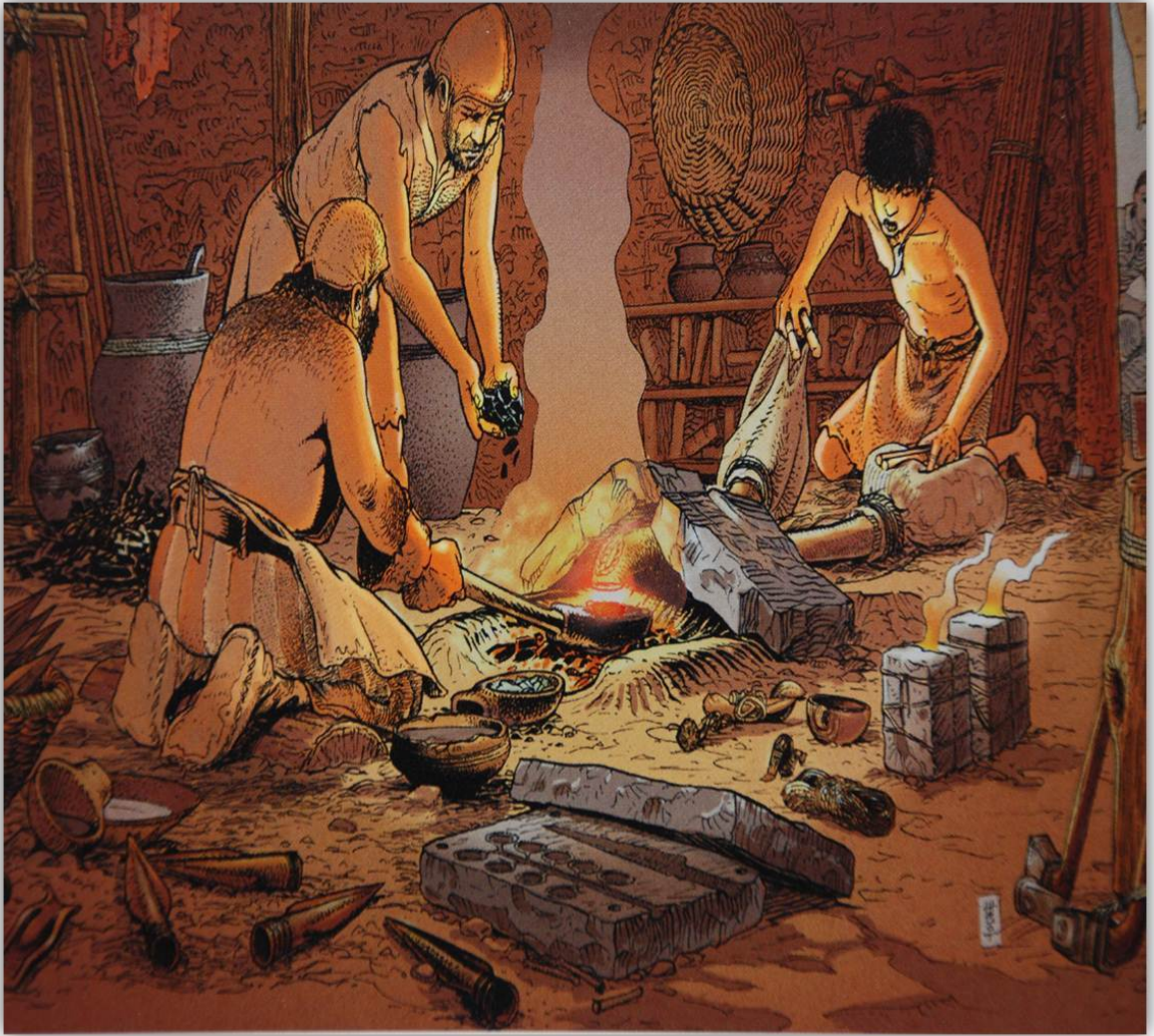
Abb. 2: Rekonstruktion einer bronzezeitlichen Werkstatt für Bronzeguss. Im Vordergrund Gussformen aus Stein sowie frisch gegossene Bronzeprodukte, hier z.B. Lanzen spitzen.