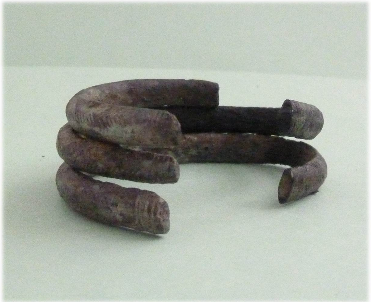
Abb. 9: Reste der aus Bronze gegossenen und durch Einritzmuster verzierten Beinringe aus dem Frauengrab von Seehaus/Aschau (Slg. Aringer).