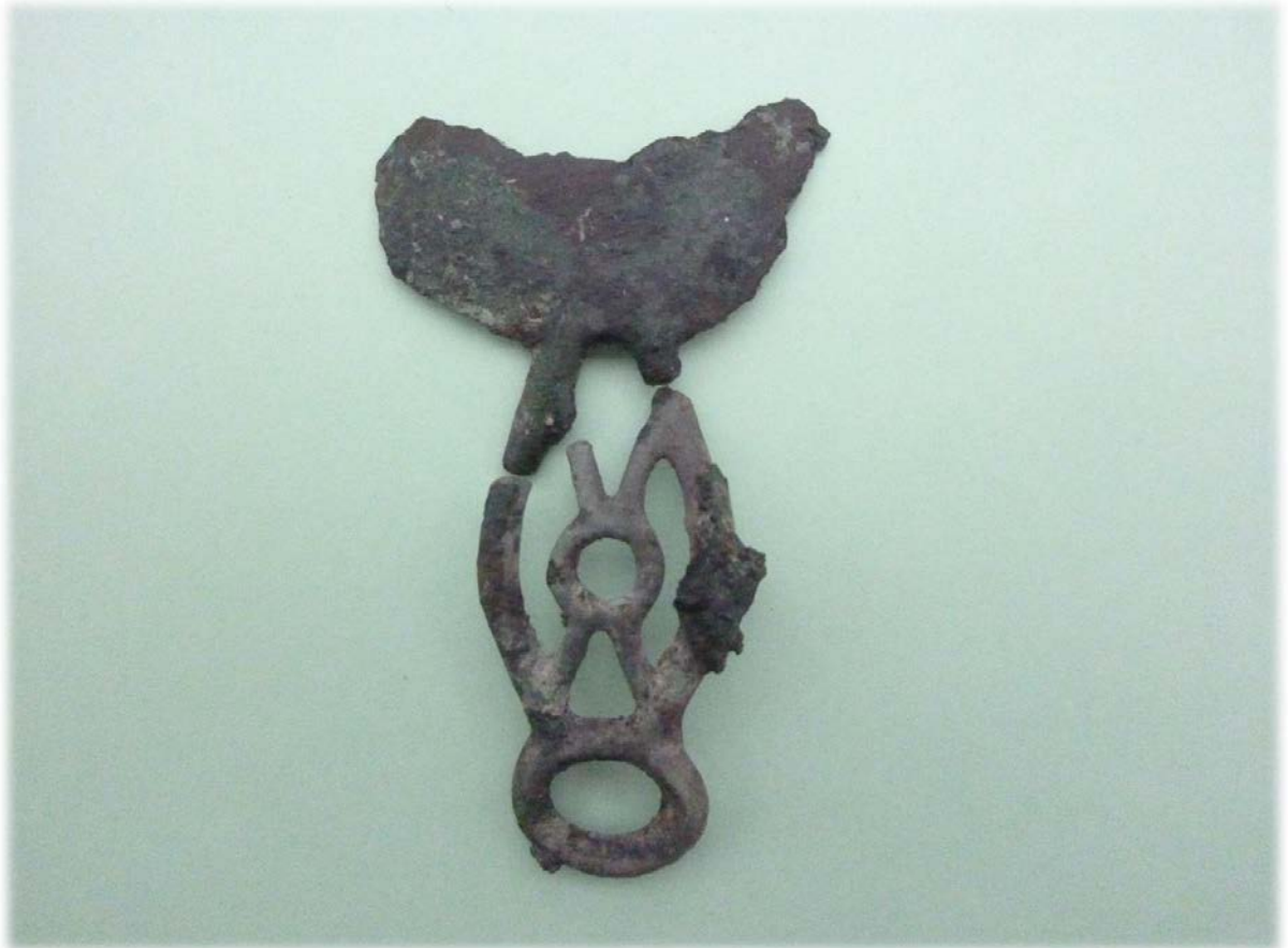
Abb. 8: Halbmondförmiges Rasiermesser aus gegossener Bronze, aus dem Männergrab von Seehaus/Aschau (Slg. Aringer).