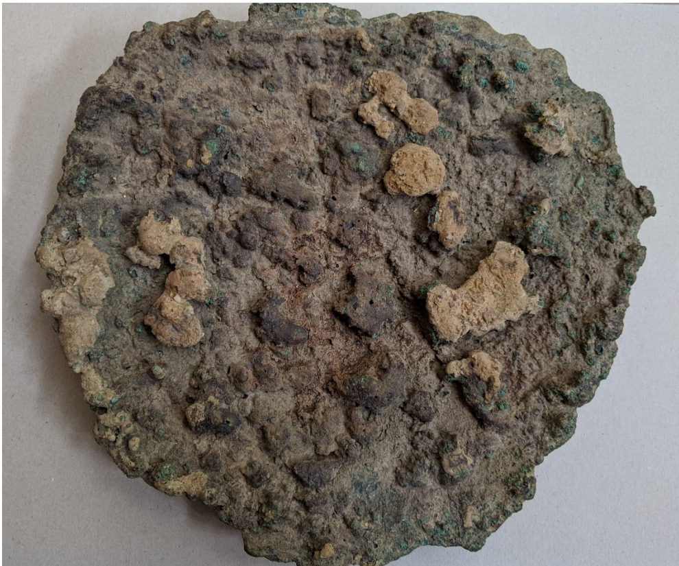
Abb. 1: Schalenförmiger Kupferbarren, sog. „Gusskuchen“ (Slg. Aringer; oben Seitenansicht, unten Aufsicht).