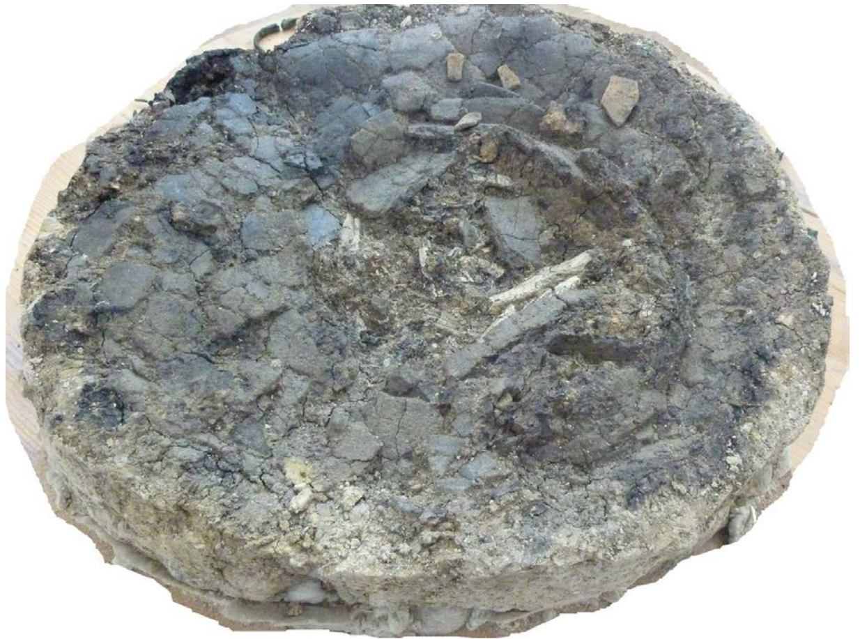
Abb. 7: Durch die Jahrtausende platt gedrückte Tonurne, in der Mitte sind Reste des Leichenbrands zu erkennen (Slg. Aringer).