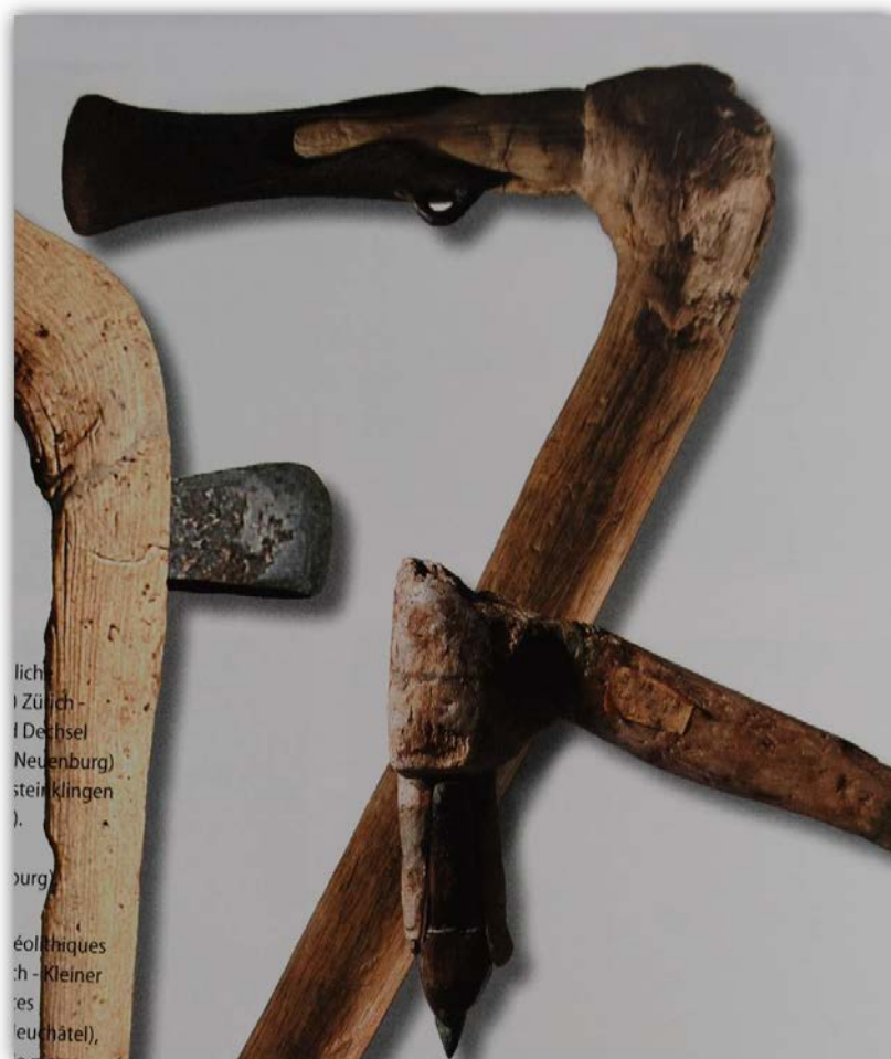
Abb.6: Aus Bronze gegossenes Beil der späten Bronzezeit (oben; Slg. Aringer). Rekonstruktionen bronzzeitlicher Werkzeuge (unten).